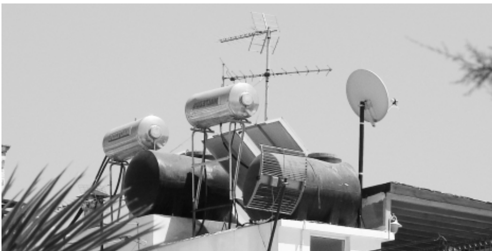
Niemal na każdym domu w Grecji (tutaj Kreta) znajduje się instalacja do podgrzewania wody za pomocą słońca.

W końcu maja w Sali Warszawskiej Pałacu Kultury i Nauki odbyło się IV Forum Przemysłu Energetyki Słonecznej. Tak jak w ubiegłym roku –