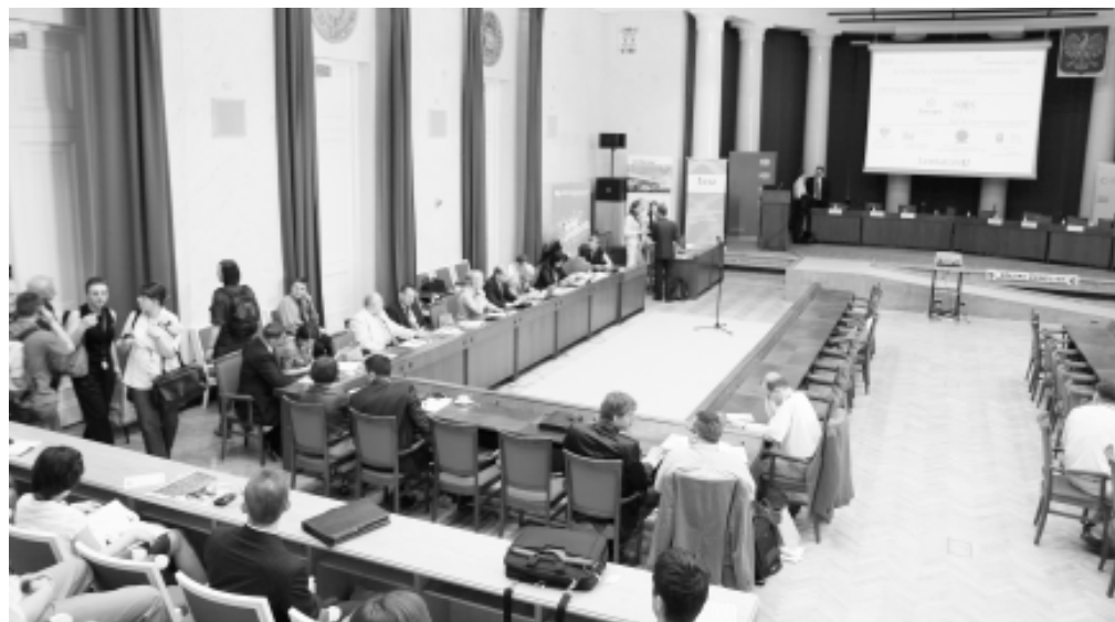
Sala posiedzeń stołecznego samorządu tym razem posłużyła obradom IV Forum Przemysłu Energetyki Słonecznej.

Polska nie leży w regionie, w którym zasoby energii słonecznej są na-