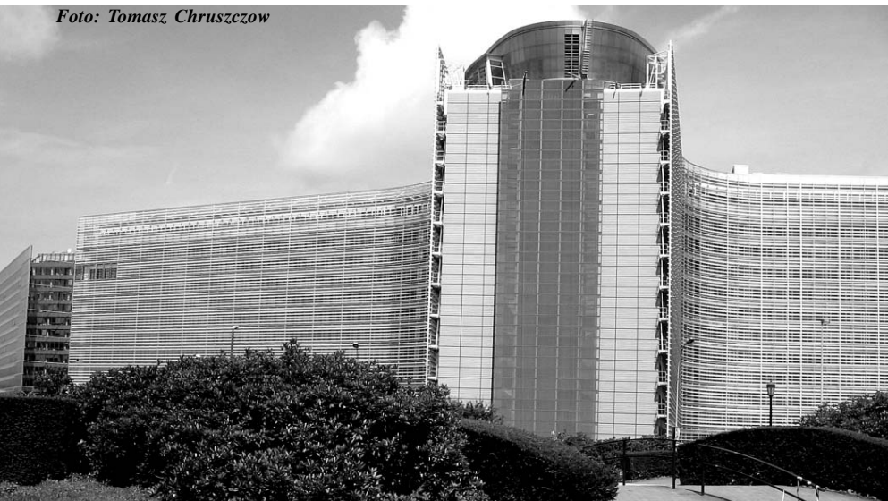
Komisja Europejska w Brukseli podda nas w najbliższych tygodniach, a może i miesiącach, trudnej próbie: testowi na wytrzymałość i cierpliwość.