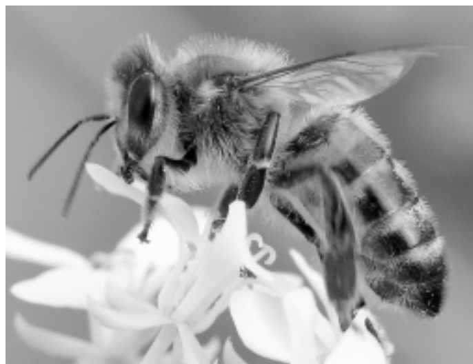
Niektóre gatunki roślin mogą istnieć wyłącznie dzięki temu, że są zapylane przez pszczoły.

A może największym winowajcą jest człowiek, skoro w wielkim stopniu przekształca środowisko naturalne, niszczy bioróżnorodność stosując monokulturowe uprawy oraz wprowadzając coraz bardziej agresywne środki ochrony roślin. Tam gdzie nadmiarze stosuje się opryski i chemiczne nawozy, pszczoły po prostu giną. Profesor Władysław Huszcza zwraca uwagę, że obecnie ocena toksykologiczna pestycydów w nektarze i pyłku jest oparta na określeniu stężenia substancji czynnej w materiale pobranym bezpośrednio z rośliny. Pomijany jest natomiast fakt, że pszczoły w trakcie przerabiania nektaru na miód zagęszczają surowiec wielokrotnie. Pobierają wiele razy porcje przerabianego nektaru nie spożywając go w całości. Mają zatem styczność z dużą ilością substancji toksycznych.