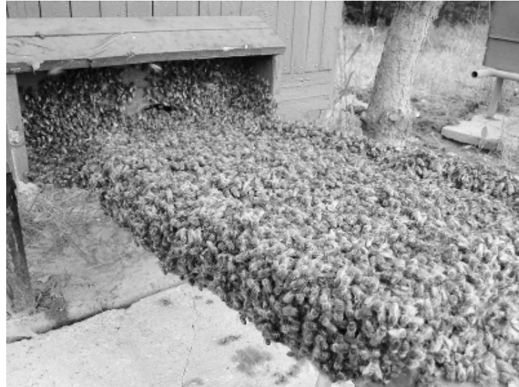
Nowy rój zasiedla ul. Oby ten widok był coraz częstszy.

„Kiedy pszczoła zniknie z powierzchni Ziemi, człowiekowi pozostaną już tylko cztery lata życia. Skoro nie będzie pszczoł, nie będzie też zapylania. Zabraknie więc roślin, po-