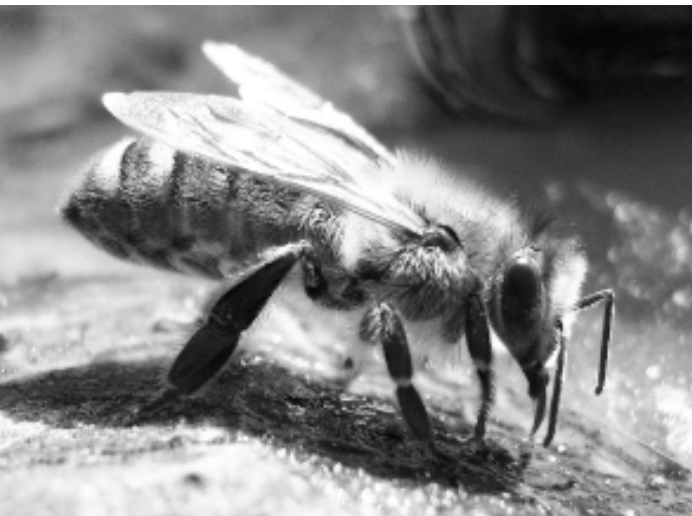
Niektórzy twierdzą, że ludzkość bez pszczoł nie przetrwa. Oby byli złymi prorokami...