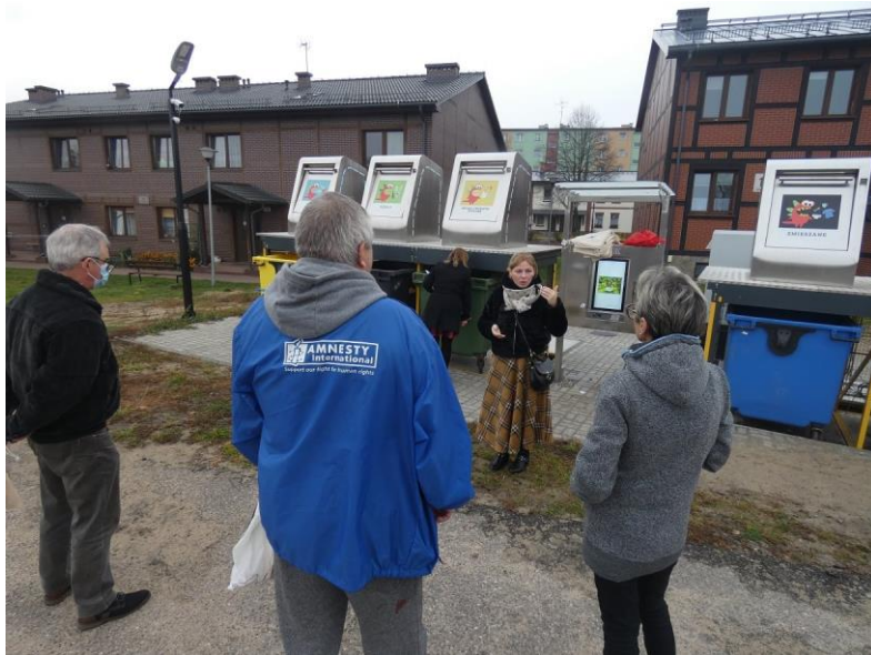
Fot. 4. Lekcja segregacji odpadów