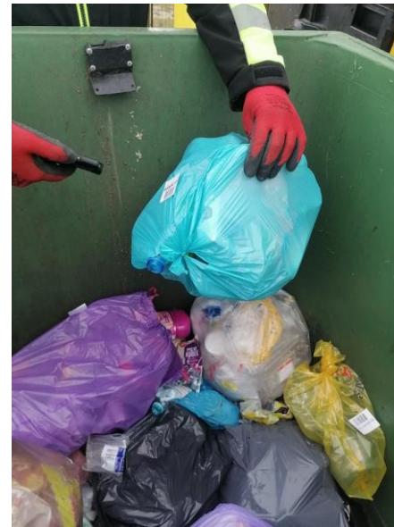
Fot. 5. Kontrola segregacji odpadów