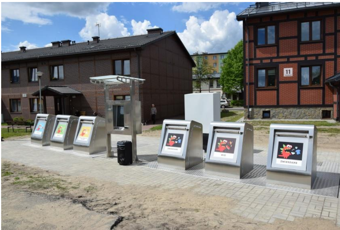
Fot. 3. System Monitorowania Odpadów w Kępicach